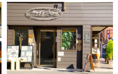
環七に面した角地にあります