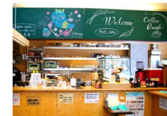
黒板アートが素敵な店内