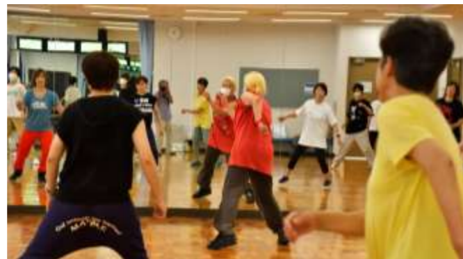
細かく区切って振付けを確認しながら練習を重ねます

サークル活動以外にも、不定期でストレッチ等の活動で集まったり、お買い物情報を共有し合ったりと、メンバー同士とても仲が良いそうです。