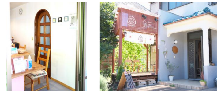
イートインスペース

一番人気である「にぎりむすび弁当」は、にぎりむすび2つ・副菜2種・だし巻き卵と満腹感たっぷり！どれもホッとさせるやさしい味付けで、毎日でも食べたくくなります。