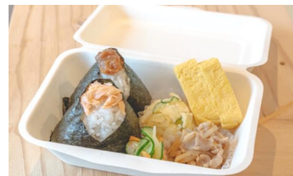
一番人気の『にぎりむすび弁当』