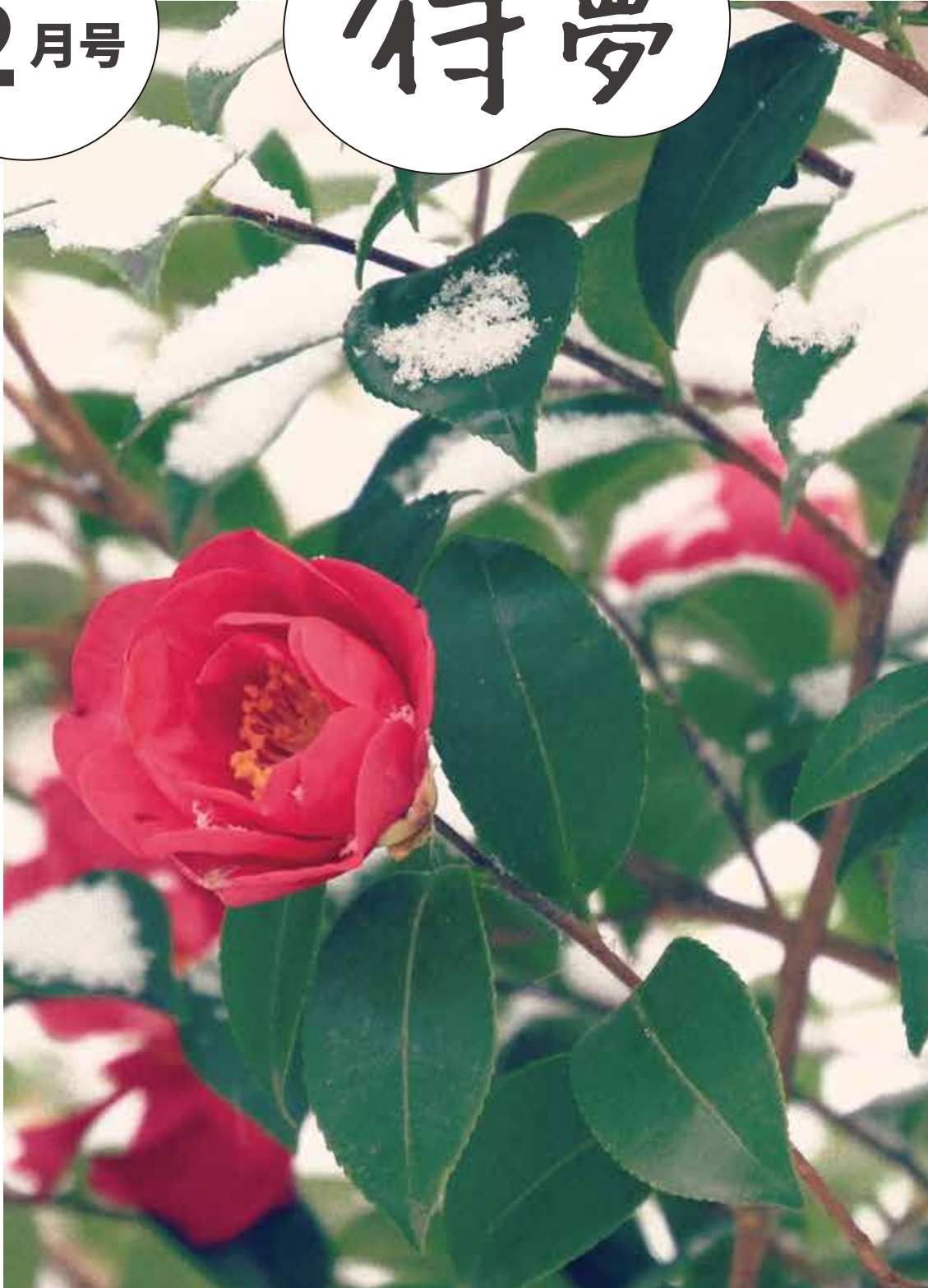
撮影地：東京 皇居東御苑

東和だより (P 2~3)・講座イベント情報 (P 4~6)・カラダに効くトピックス (P 7)・ 図書館情報 (P 8~9)・住区センターの予定 (P10)・東和センターカレンダー (P11)