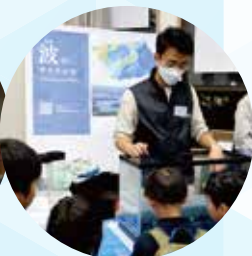
学生考案の実験を間近で見れます。(写真とは内容が異なります)