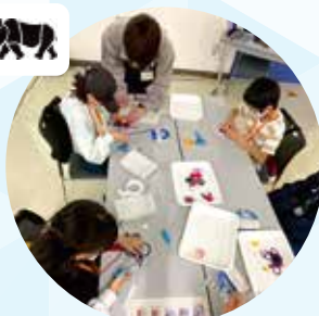
昨年は「はたおり機」を工作。

夏休みなどに開催して好評の、東京工業大学の科学サークル「サイエンステクノ」による科学工作を今年も開催。単なる工作ではなく、大学生が科学の考え方も教えてくれます！