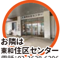
お隣は 東和住区センター 電話:03-3628-6206