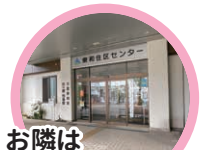
お隣は 東和住区センター 電話:03-3628-6206