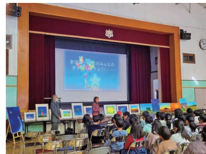
講師の問いかけにも元気に答えてくれました。