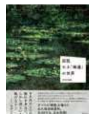
『図説 モネ「睡蓮」の世界』 安井 裕雄／著 創元社