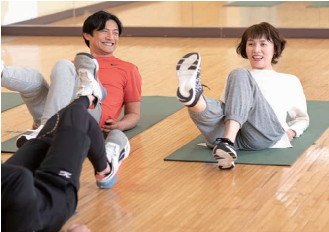
仲間と一緒に楽しみながらレッスンしましょう！