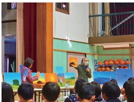
熱意のあるメッセージをいただきました。

こうして毎日、元気で毎日学校に来て、お勉強したりお友達と先生とご家族と地域の皆さんと、過ごしていけるのは、本当に「幸せ」なんだ、「ありがとう」なんだと思っています。