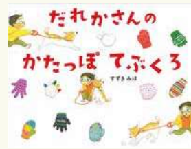
『だれかさんのかたっぽてぶくろ』 すずき みほ／著 ほるぷ出版

自分の手をじっくりかたどり、ハサミで切り取ります。おにいさんおねえさんは自分で、ちいさな子はお家の人に手伝ってもらって。最後に、額縁に飾って総仕上げ。それぞれ素敵な手袋ができました。こんなに素敵に出来上がったのですから、ぜひみなさんにも見てもらおうと、はりきって撮影させていただきました。