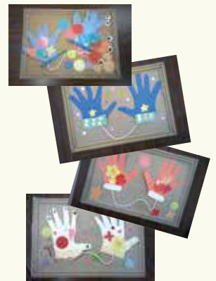
みんなすてきな手袋を作ってくれました。