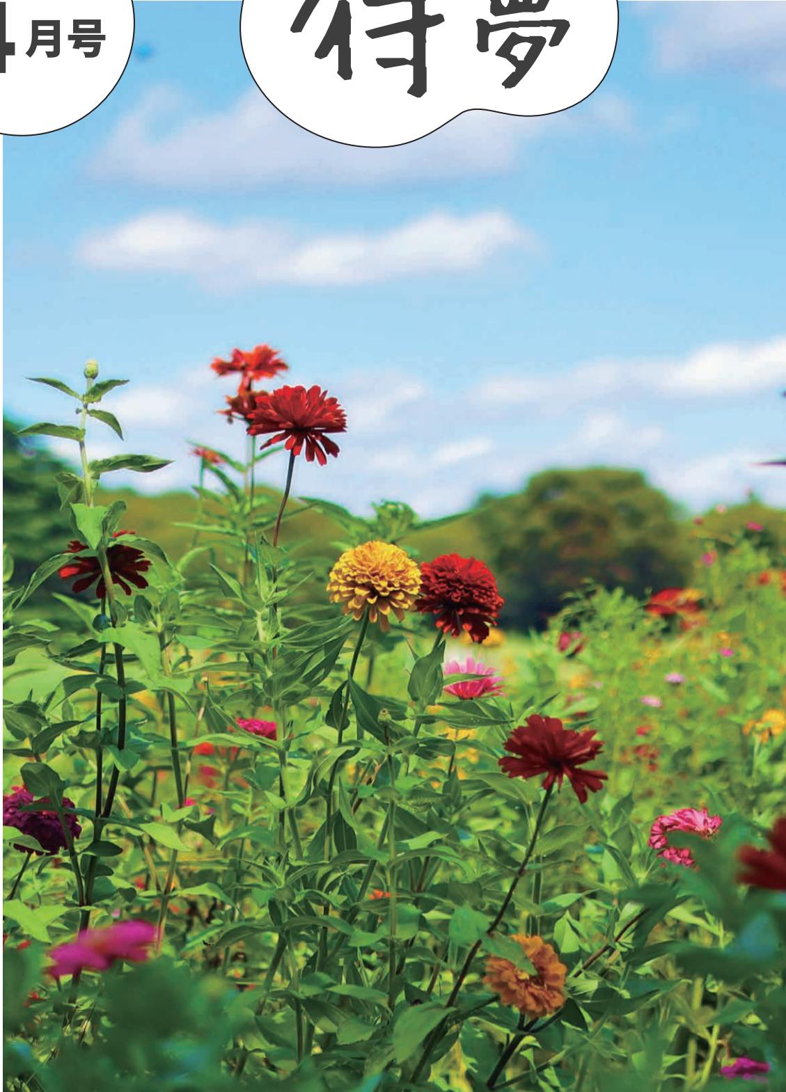
撮影地：国営昭和記念公園

東和だより (P2~3)・講座イベント情報 (P4~6)・カラダに効くトピックス (P7)・ 図書館情報 (P8~9)・住区センターの予定 (P10)・東和センターカレンダー (P11)