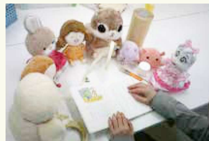
ぬいぐるみたちが本の修理をお手伝い

ぬいぐるみたちのおとまりの様子は、図書館員が写真に撮って、おむかえの時にプレゼントしました。写真には、ぬいぐるみたちが図書館でのおとまりを楽しんでいる様子を納めました。おむかえにきてくれた人たちは、おとまり中にぬいぐるみが選んでくれた本を借りて、みんなニコニコしていました。