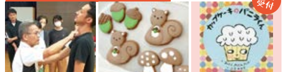
女性のための護身術 アイシングクッキー作り おはなし会と折り紙

当日の詳しい内容・スケジュールはセンターで配布しているパンフレットやQRコードのリンク先をご覧ください。