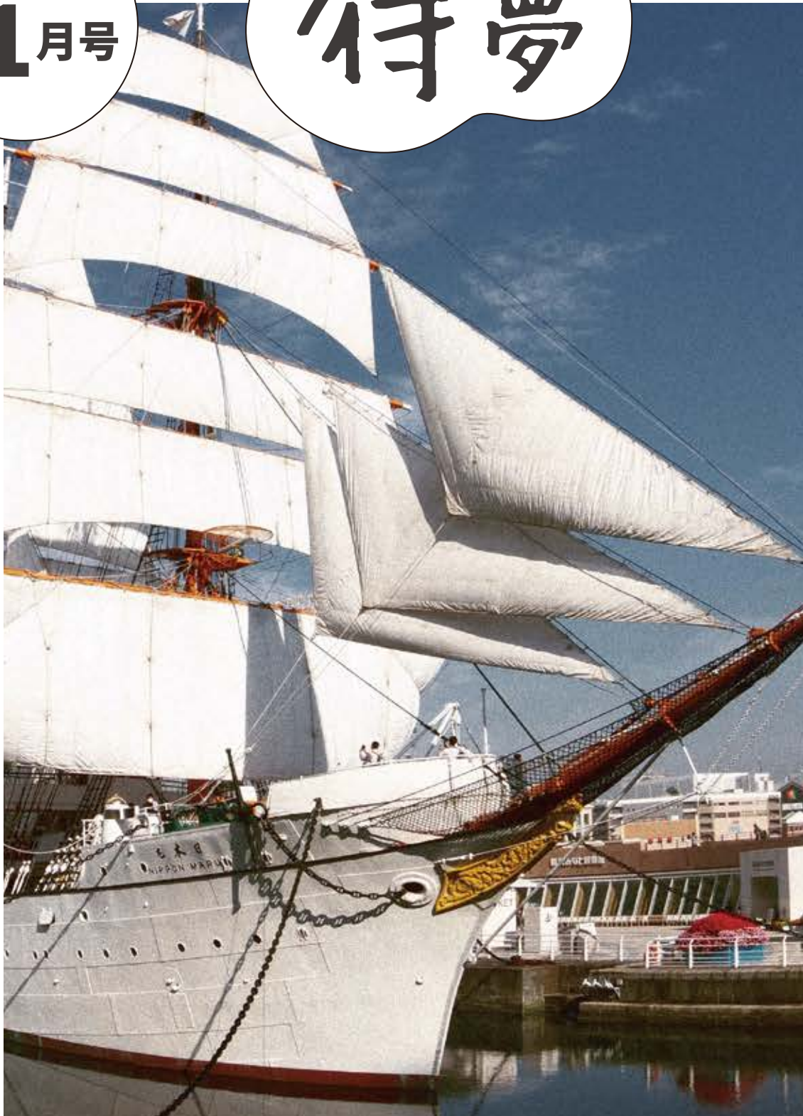
「日本丸」撮影地：横浜