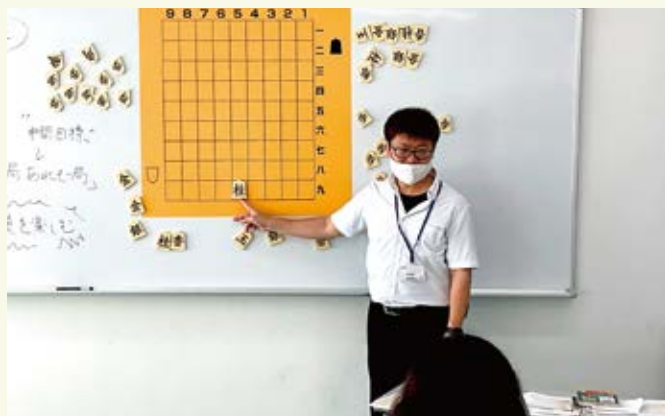
駒の動かし方からひとつひとつ勉強

こちらの講座は、11月にも開催予定です。また、図書館には将棋に関する本がたくさんありますので、こちらもぜひ活用ください。