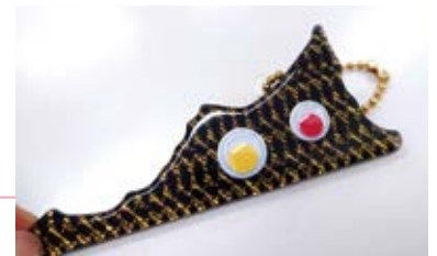
「めだまモンスター」のキーホルダー

今回の made in 東和は、アクリルパーツの加工専門会社である(有)三幸様の店舗で開催。SDGsへの取り組みやお仕事の内容について伺ったあと、カラフルな「カケラ」を使って「めだまモンスター」のキーホルダーを作りました。(カケラとは、アクリルの型を抜いてできた端材をツヤツヤに磨いた、アップサイクルアイテムのこと。)