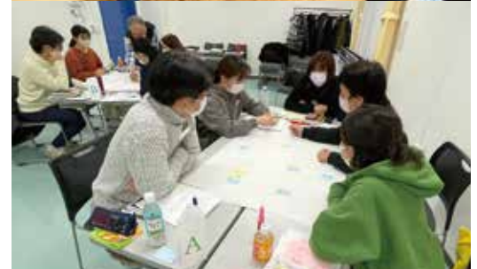
前回のフィールドワークやグループワークの様子