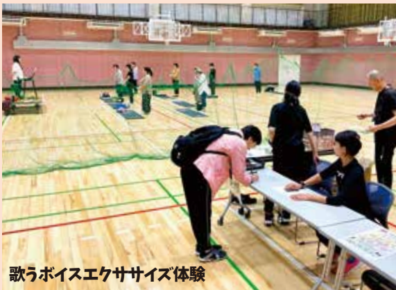
歌うボイスエクササイズ体験