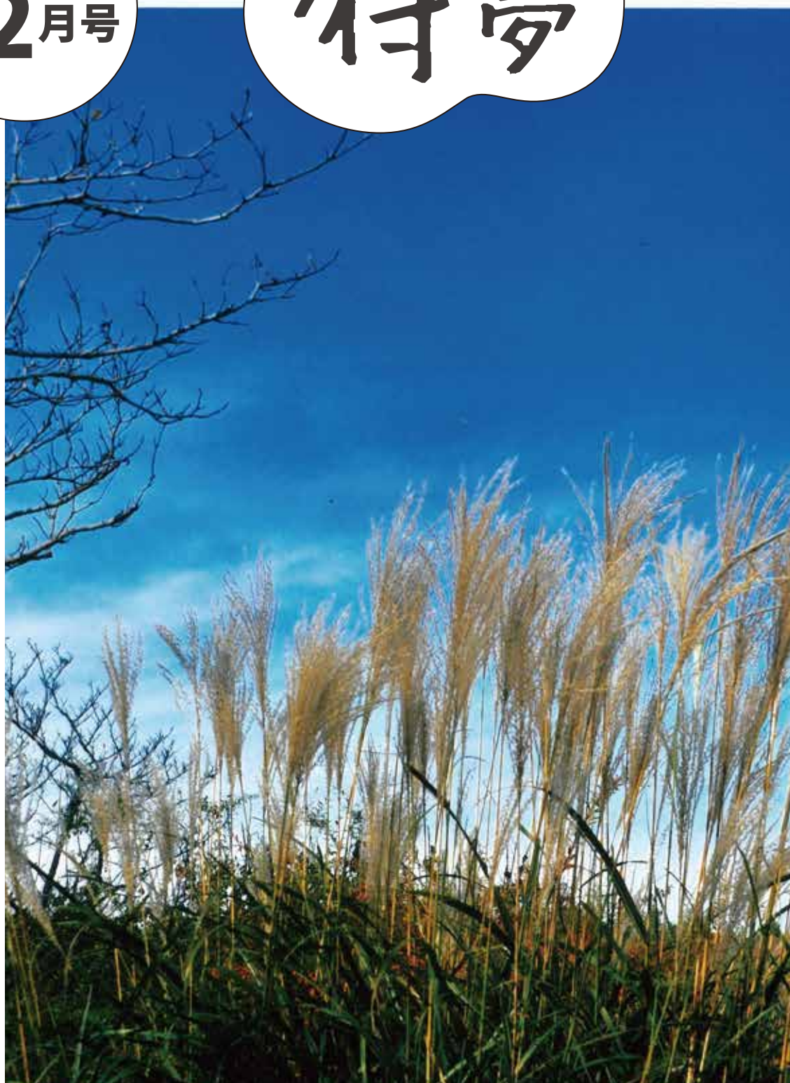
撮影地：千葉県柏の葉公園