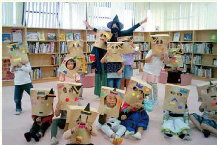
自分だけのモンスターのお面でおはなし会

ハロウィーン気分を盛り上げてくれました。また、参加してくれた方全員に、折り紙でつくったキャンディーのおみやげをお渡しました。こちらも大変好評でした。