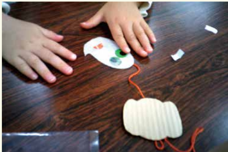
ハロウィーン飾りを作成中です

毎月第3日曜日は、おはなし会に+(プラス)して、工作会や簡単な運動などを実施しています。くわしくは図書館までお問合せください。ご参加お待ちしております。