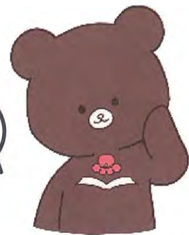
公式マスコットキャラクター うめクマ