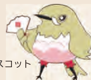
梅田地域学習センターマスコット キャラクター「ウメジロ」