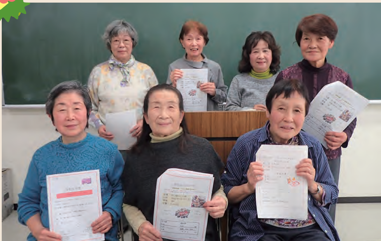
パソコンサークル「あじさい」のメンバーの集合写真です。 詳細は P2 をご覧ください。