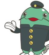
足立区生涯学習センター 公式キャラクター「ナマガクくん」