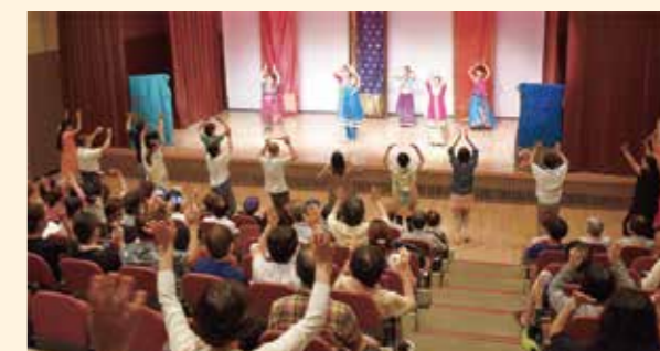
お客様もステージ前で Bollywood ダンス