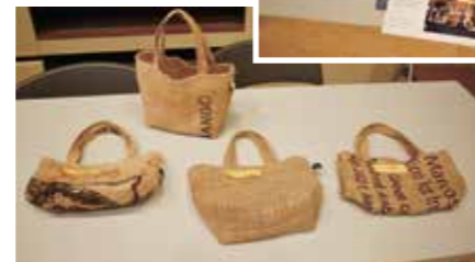
コーヒーの入っていた麻袋から作ったバッグ (東京未来大学)▼