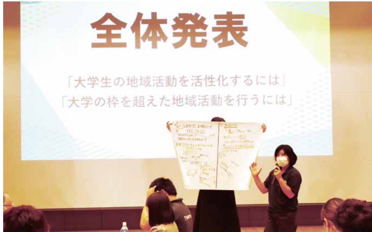
交流ワークショップで話し合われたことを発表