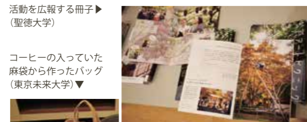
活動を広報する冊子▶ (聖徳大学)