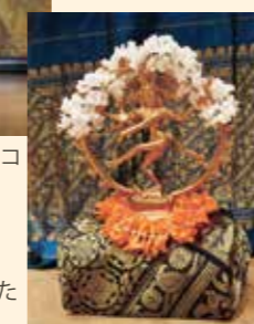
ステージに飾られたシヴァ神