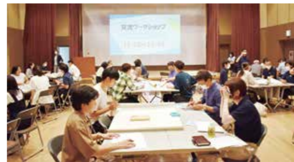
6大学の各学生が一緒にテーブルで話し合った交流ワークショップ

大学生の他、地域の方も参加して交流会が行われました。「地域活動の活性化」や「大学の枠を超えた活動」などが話し合われました。“活動に必要な資金は助成金などで賄う”、“大学ボランティア連合を作ろう”、“SNSで他の大学とつながる”など活発な意見が飛び交いました。イベント後半では各大学の垣根もなくなっているようでした。