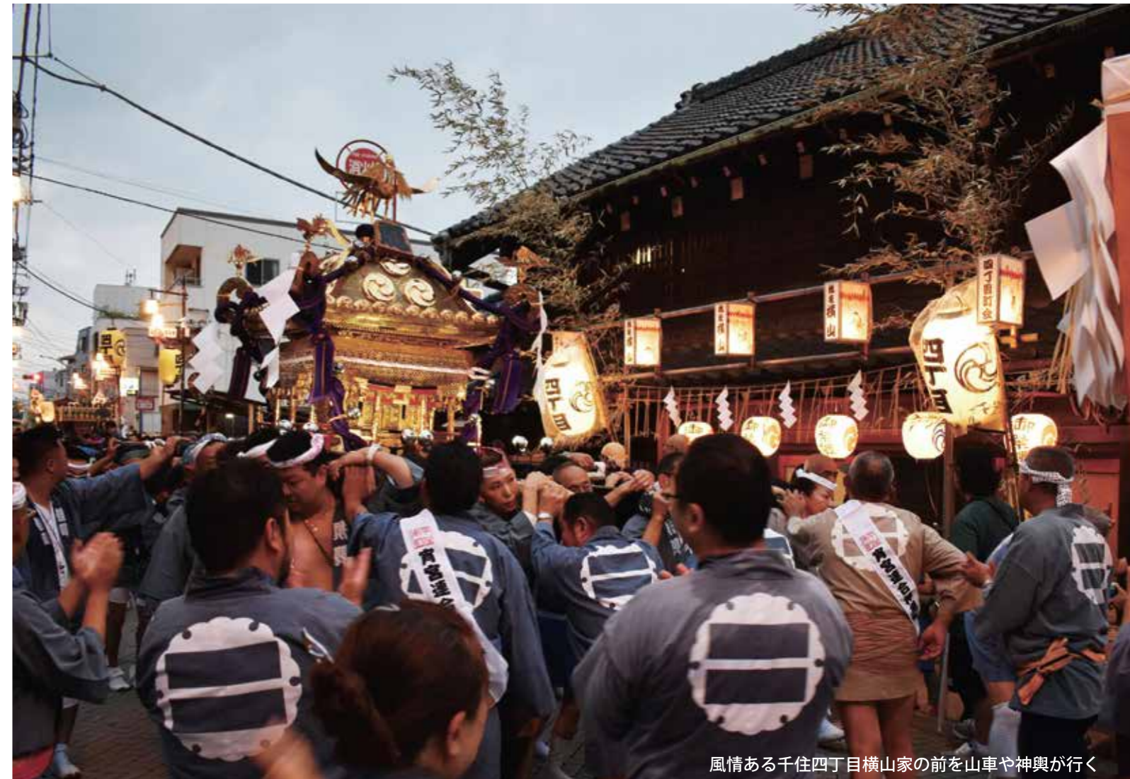
風情ある千住四丁目横山家の前を山車や神輿が行く

11月号の特集は宵宮。 9月9日(土)4年ぶりに開催された 千住本町連合会による五町会連合神輿渡御。 獅子頭を先頭に神輿や囃子山車など列を組んで 旧日光街道を進んで行きました。