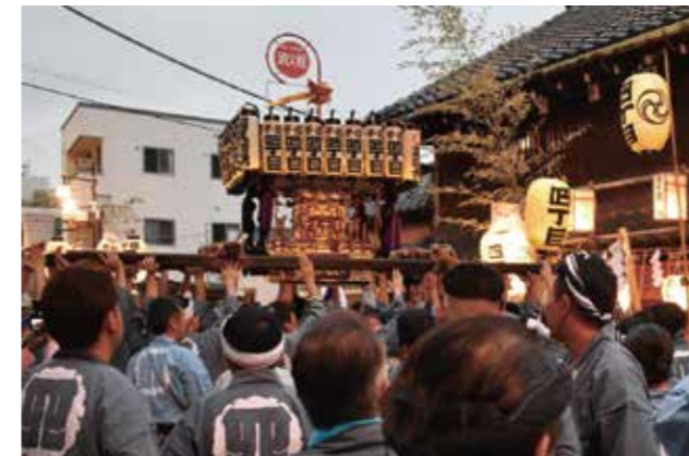
地元横山家の前で高く担ぎ上げられた四丁目の神輿