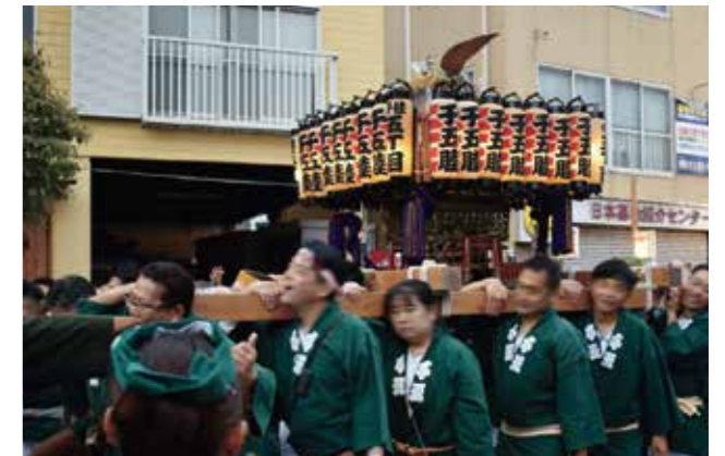
五丁目の板垣通りを出発する千五睦の神輿