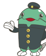
足立区生涯学習センター 公式キャラクター「ナマガクくん」