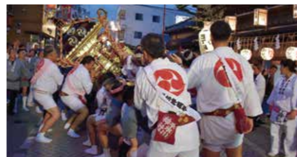
神輿振りをしながら宿場町商店街進む三丁目本氷川神社の神輿

神輿渡御は板垣通りから旧日光街道に入り、四丁目の大提灯を掲げる横山家の前を山車や、神輿が通っていく様は一昔前に戻ったような風情。宿場町通りを通るころには観衆が道にあふれ、その熱気を伴って千住一丁目まで神輿の行列は進んでいきました。宵宮は千住の初秋の風物詩、また来年も無事に開催できることを期待して祭りを後にしました。