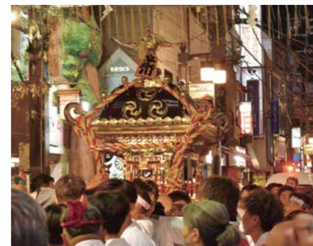
神輿振りだけでなく独自にライトアップして金色がまぶしい三丁目の神輿