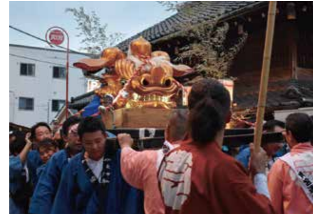
一丁目の大獅子頭、オスとメスがあるそうで今年はメスの獅子頭が神輿の先頭に行く。