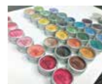
Smink Art (スミンクアート) コスメからアップサイクルした絵具