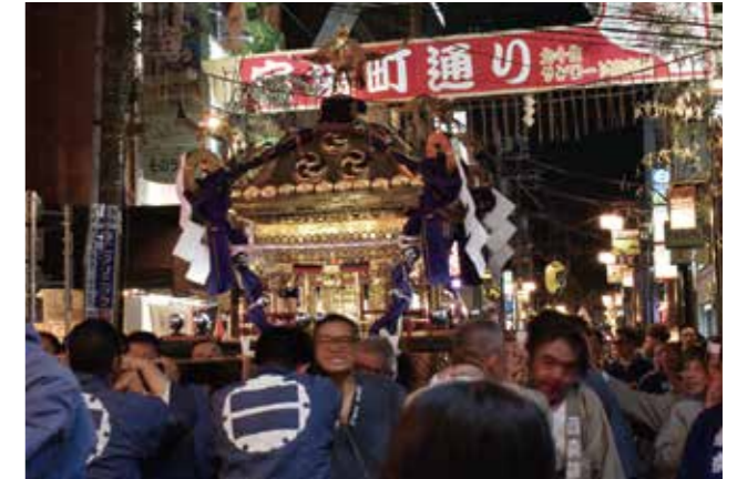
宿場町通りに行く二丁目の大きく華やかな神輿