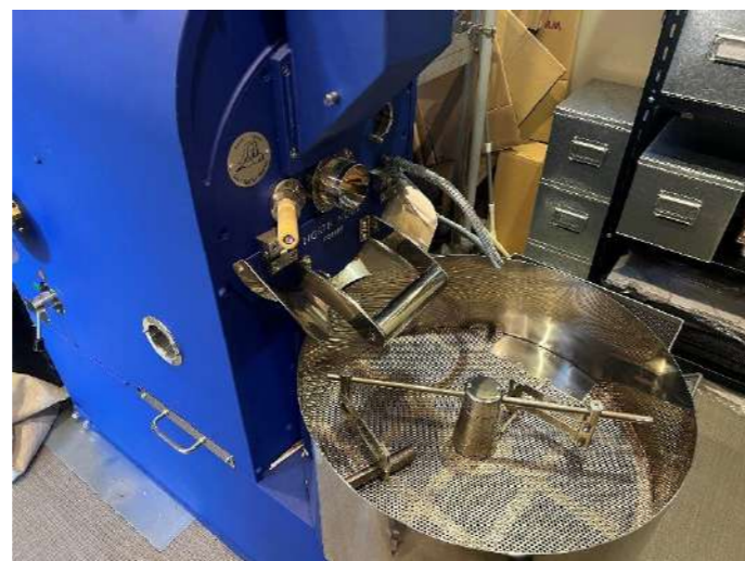
▲他ではなかなか見ることができない、5キロの豆を焙煎できる業務用の焙煎機