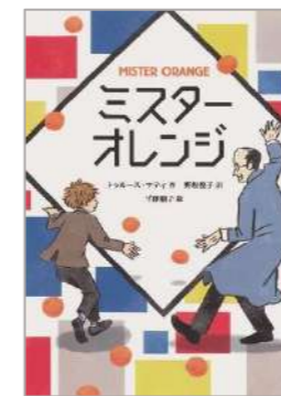
『ミスターオレンジ』 トゥルース・マティ 作 野坂悦子 訳 平澤朋子 絵 朔北社

第二次世界大戦中のニューヨーク。八百屋の息子・ライナスは戦争にあこがれ、志願兵の兄が誇りです。配達先で出会った画家・ミスターオレンジと交流する中でライナスは新しい考えに出会い、想像の持つ力を考えます。