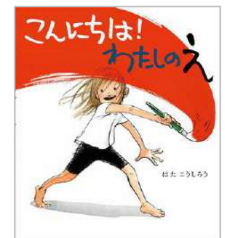
『こんにちは！わたしのえ』 はた こうしろう/作 ほるぷ出版

のびのびとダイナミックに、全身を使って夢中で絵を描く女の子。描く喜びがダイレクトに伝わってきます。カラフルな色、女の子の表情、多彩なオノマトペ、すべてに魅了され、自然と顔が笑ってしまいます。「いろがまわる いろがわらう」絵本全体からその楽しさがあふれ出して、止まらない。夢中になれるって素晴らしい。絵を描くのが好きな人も、見るのが好きな人も、大人も子どもも、みんなが笑顔になるステキな絵本です。