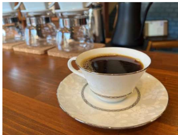
▲店名を冠するオリジナルブレンド「ノースノードコーヒー」

店内では店主にコーヒーを淹れていただくことができます。84度に温めたお湯で円を描くようにゆっくりと淹れるのが美味しく淹れるコツなんだとか。また、焙煎し立ての豆はガスを多く含むので、お湯を入れるとふっくらとドーム状に膨れ上がり、店内に香りが広がります。これが良い豆の特徴だそうで、焙煎後の時間経過とともに、少しずつこの膨らみがなくなってしまいうそうです。なので店内で焙煎するこのお店では、他ではなかなか味わうことのできない風味豊かなコーヒーを楽しむことができます。