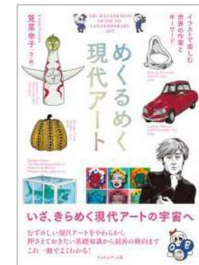
『めくるめく現代アート』 筧菜奈子/著 フィルムアート社

現代美術の主要な作家・芸術運動・キーワードがイラスト入りでわかりやすく解説された一冊。一見してやわらかい印象ながら、現代美術の主要なトピックは十分押さえられる！と思うほどの充実した内容で、楽しみながらアートについて学べます。現代美術を知りたい！と思った時にぴったりの入門書です。