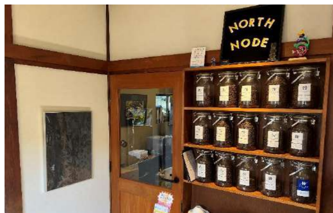
6 ▲店頭には並ぶ瓶詰のコーヒー豆は、よく見ると色やツヤに違いがあるのが分かります。