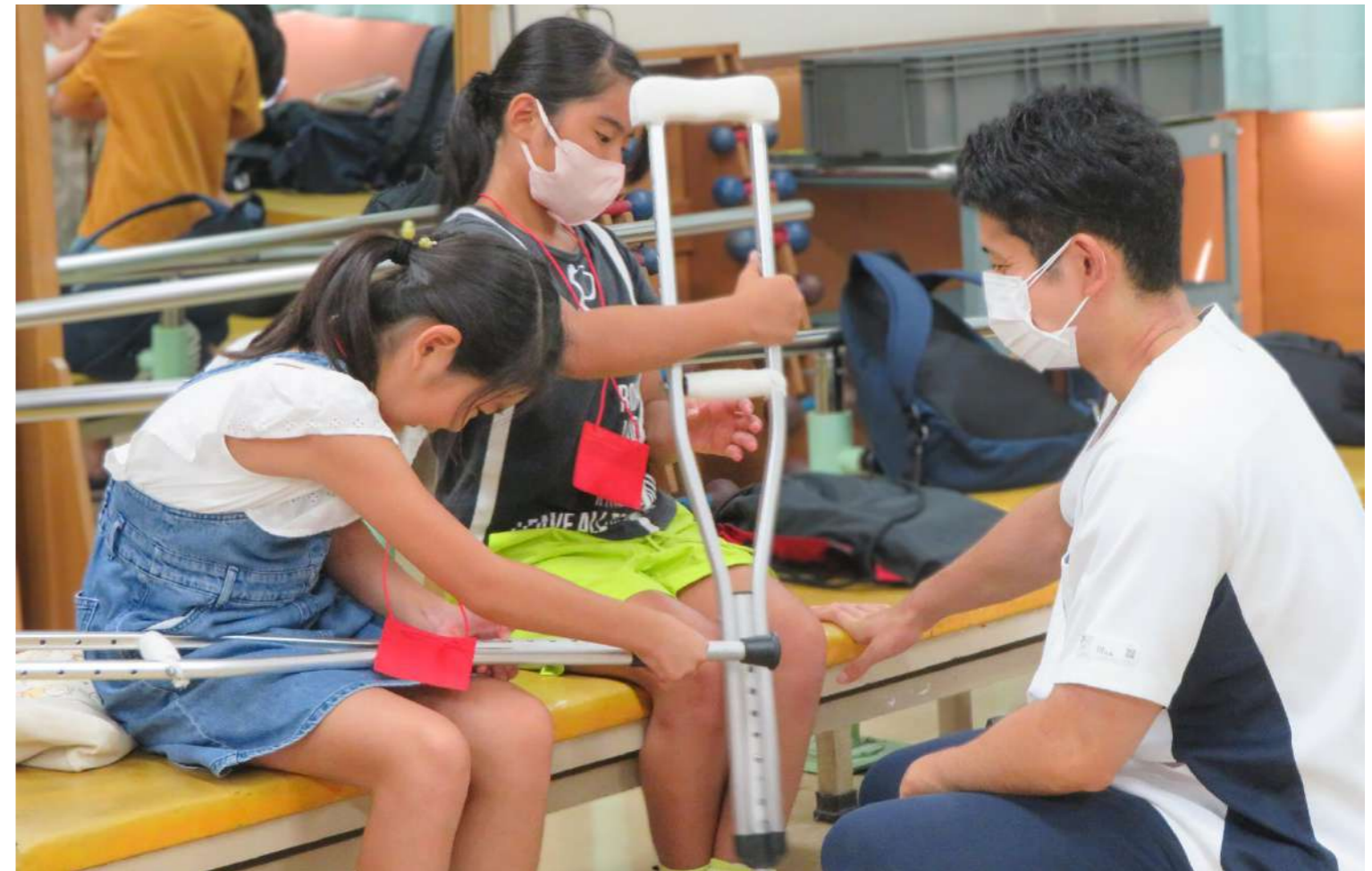
2023年8月に開催した「おしごとらんど in 竹の塚」の様子