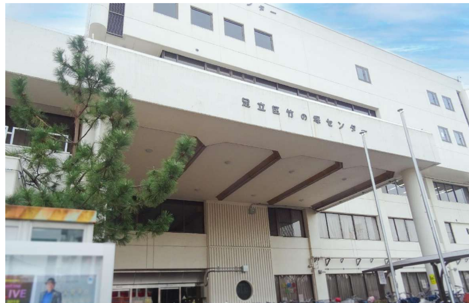
P2-3にて竹の塚地域学習センターの施設紹介をしています。