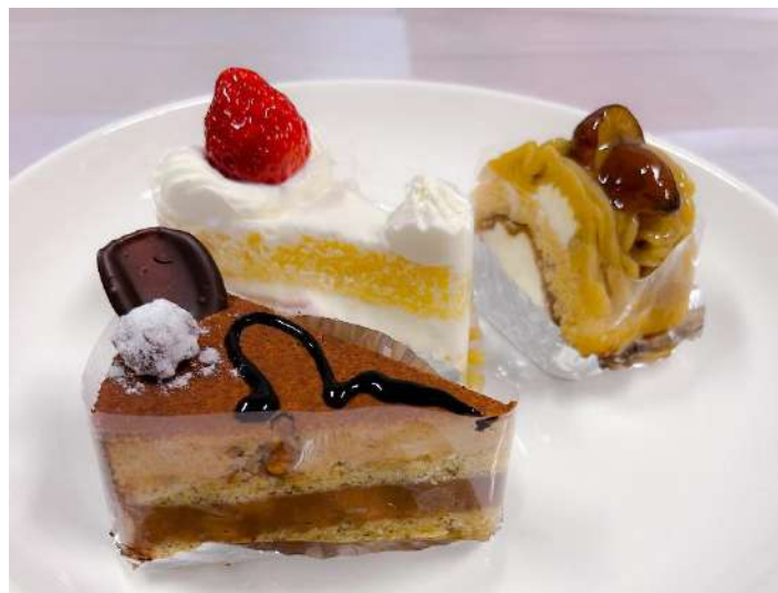
▲手前から、ノワゼットショコラ、ショートケーキ、和（なごみ）。(いずれも税込 ¥648)