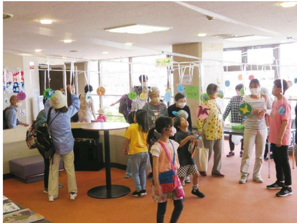
▲昨年の「ことばの力」の様子