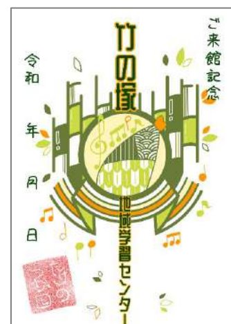
▲竹の塚地域学習センター御朱印