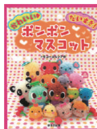
『かわいい♥だいすき! ポンポンマスコット』 著 / トモコ=ガルシア ほるぷ出版 2016年