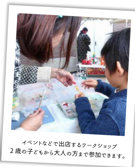
イベントなどで出店するワークショップ 2歳の子どものから大人の方まで参加できます。