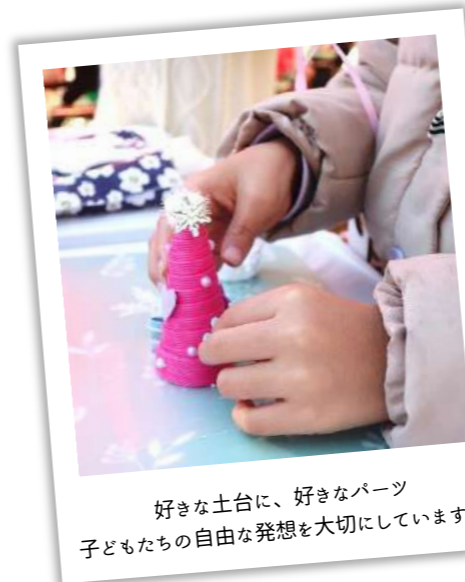
好きな土台に、好きなパーツ 子どもたちの自由な発想を大切にしています。