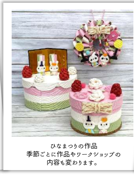
ひなまつりの作品 季節ごとに作品やワークショップの 内容も変わります。