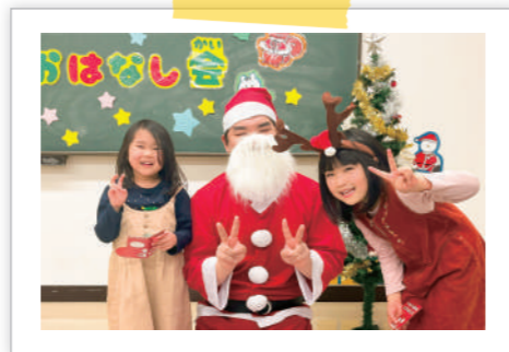
▲サンタさんと一緒にパシャリ！

最初のおはなしは『サンタのいちねんとナカイのいちねん』。サンタ役とトナカイ役に分かれ、2人で1冊の本を読み語りしました。最後に「赤鼻のトナカイ」と「ジングルベル」を歌っているとサンタさんが登場！ひとりずつ手渡しでクリスマスカードのプレゼントをもらい、子どもたちも笑顔いっぱいでした。