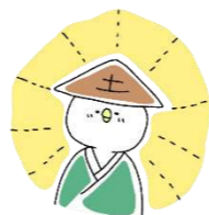
とねり丸 舎人地域学習センター・ 図書館公式キャラクター