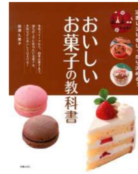
『おいしいお菓子の教科書』 著 / 柳瀬久美子 新星出版社 2018年

余談ですが、私はアップルパイを作ってみようとして、残念ながら我が家にはオーブンがないことに気づき、泣く泣く断念することに……。 (担当：鈴木)