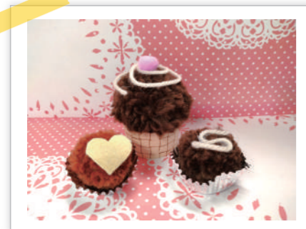
▲マフィンにはボンテンでベリーをそえて

紹介されている作品は巻き付けて、切って、貼るだけで簡単に作ることができます。さらに、フェルトや金具を使えば、鉛筆キャップやバレッタなど、バリエーション豊かに作ることができるようになっています。かわいらしいイラストと写真で作り方が載っているので、気軽に楽しめる一冊です。 (担当：小野)