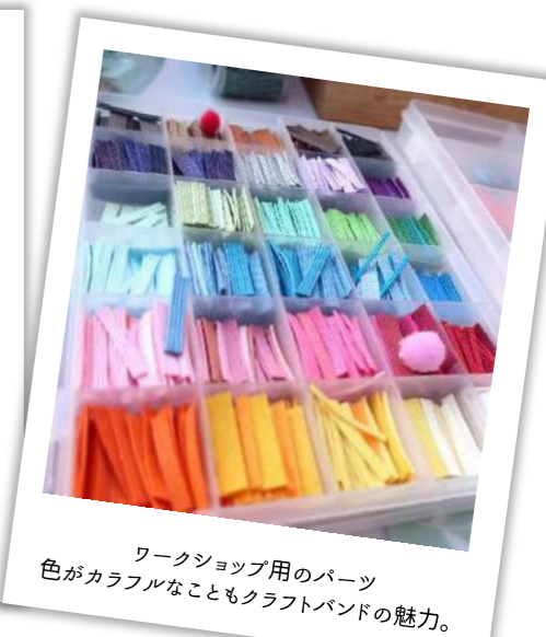
ワークショップ用のパーツ 色がカラフルなこともクラフトバンドの魅力。