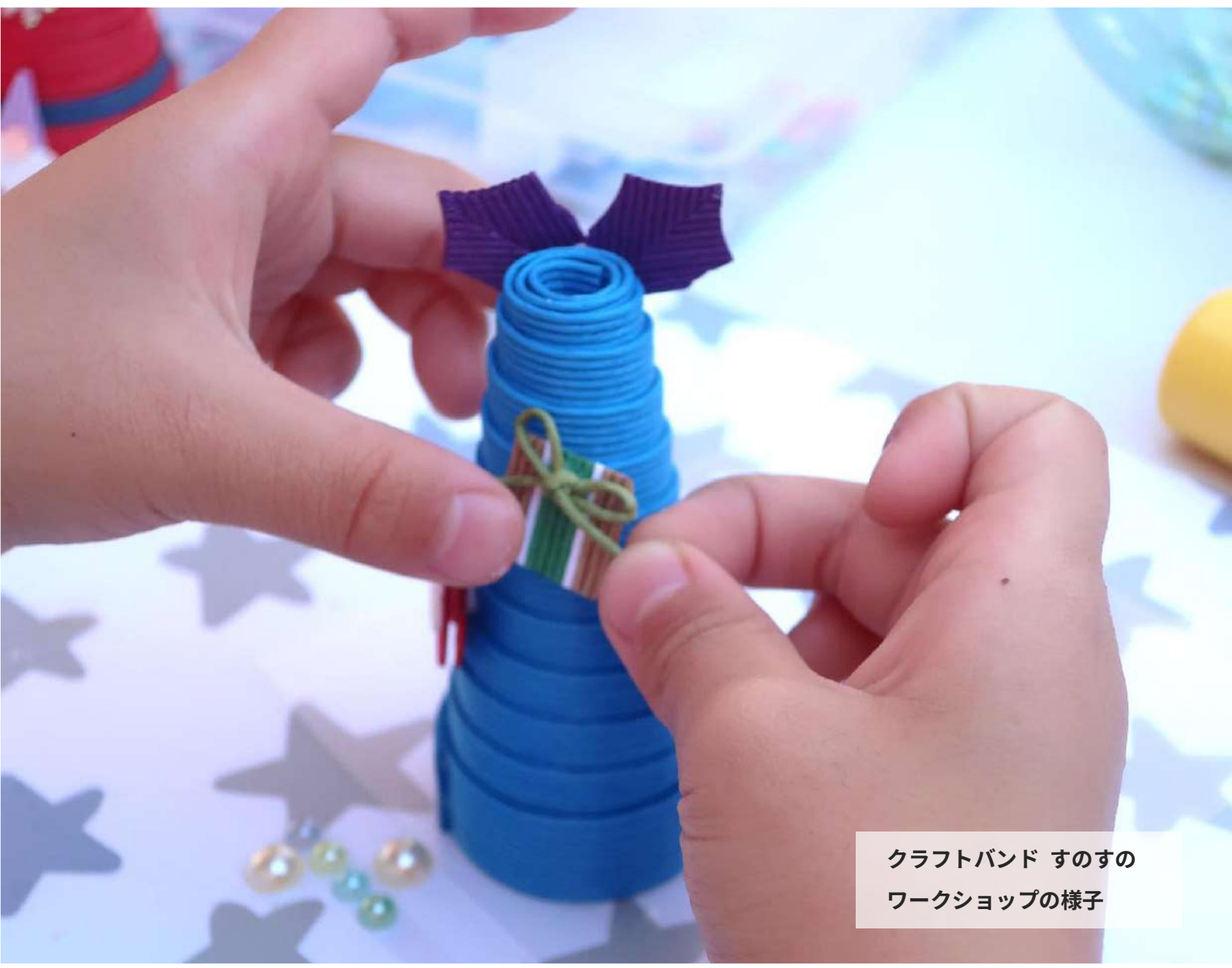
クラフトバンド すのすの ワークショップの様子