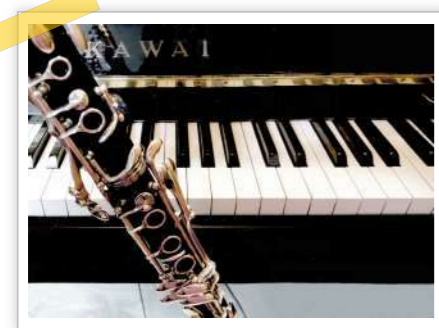
▲十数年ぶりに触った我が家の楽器たち。