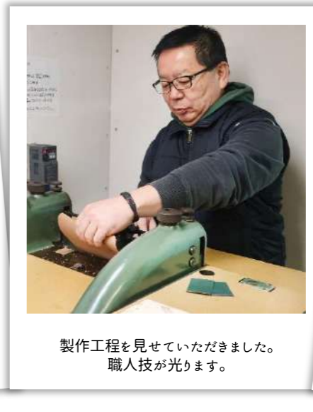
製作工程を見せていただきました。職人技が光ります。