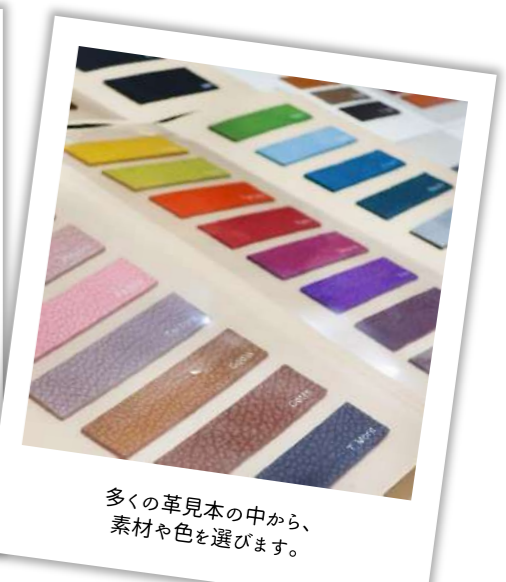
多くの革見本の中から、素材や色を選びます。