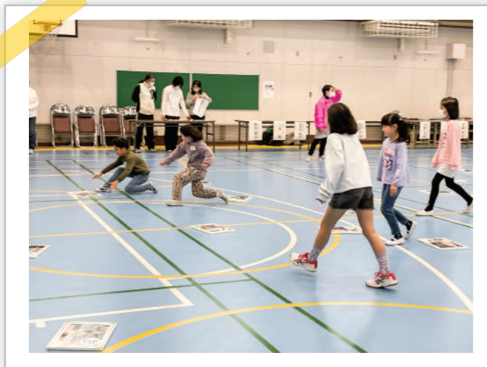
▲大きな絵札を子どもたちが駆け回って集めます。

今回は2・3年生の部で、同数により1対1の真剣勝負の場面も！ 最後は参加者の保護者など、大人も参加して大盛り上がりで 今大会は幕を閉じました。