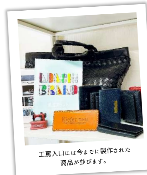
工房入口には今までに製作された商品が並びます。

丈夫な革素材でできた製品は、使用者とともに歩む歴史を刻みます。またギフト需要も高いため、親・子・孫と世代を超えて長く愛されます。革製品の製作は「思い出に残る仕事」なのだから。ヴェールポイントは、こだわりの素材と職人技術の結晶で、過去から未来へと続くものづくりを手掛けます。