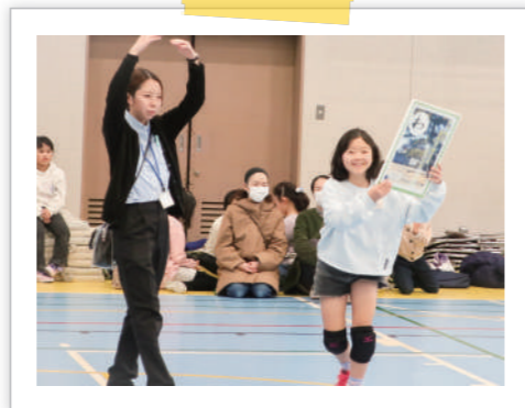
▲誇らしげに絵札をかかげます。

この大会は今年で11回目。以前にも参加してく れた子どもたちも多く、とても白熱する戦いにな りました。