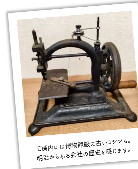
工房には博物館級の古いミシンも、明治からある会社の歴史を感じます。