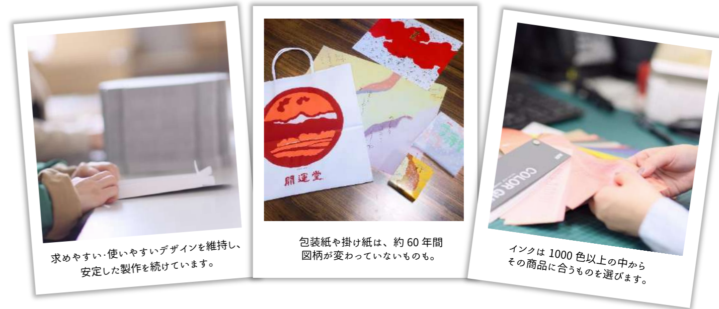
求めやすい・使いやすいデザインを維持し、安定した製作を続けています。