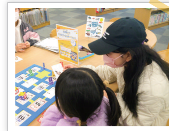
▲ゲーム中、クイズに真剣に取り組む参加者たち。

最初は、図書館の本を使ってクイズを作る難しさに頭を悩ませる参加者の姿も見られましたが、だんだんと慣れ、中には「次はこの問題にする!」と笑顔で報告に来てくれる子も。