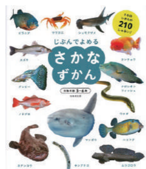
『じぶんでよめるさかなずかん』 編著 / 成美堂出版編集部 成美堂出版 2021年

うみのいきもの210種類を生息場所別に紹介。わかりやすい解説付きで、小さいお子さんも親しみながら読むことのできる1冊です。