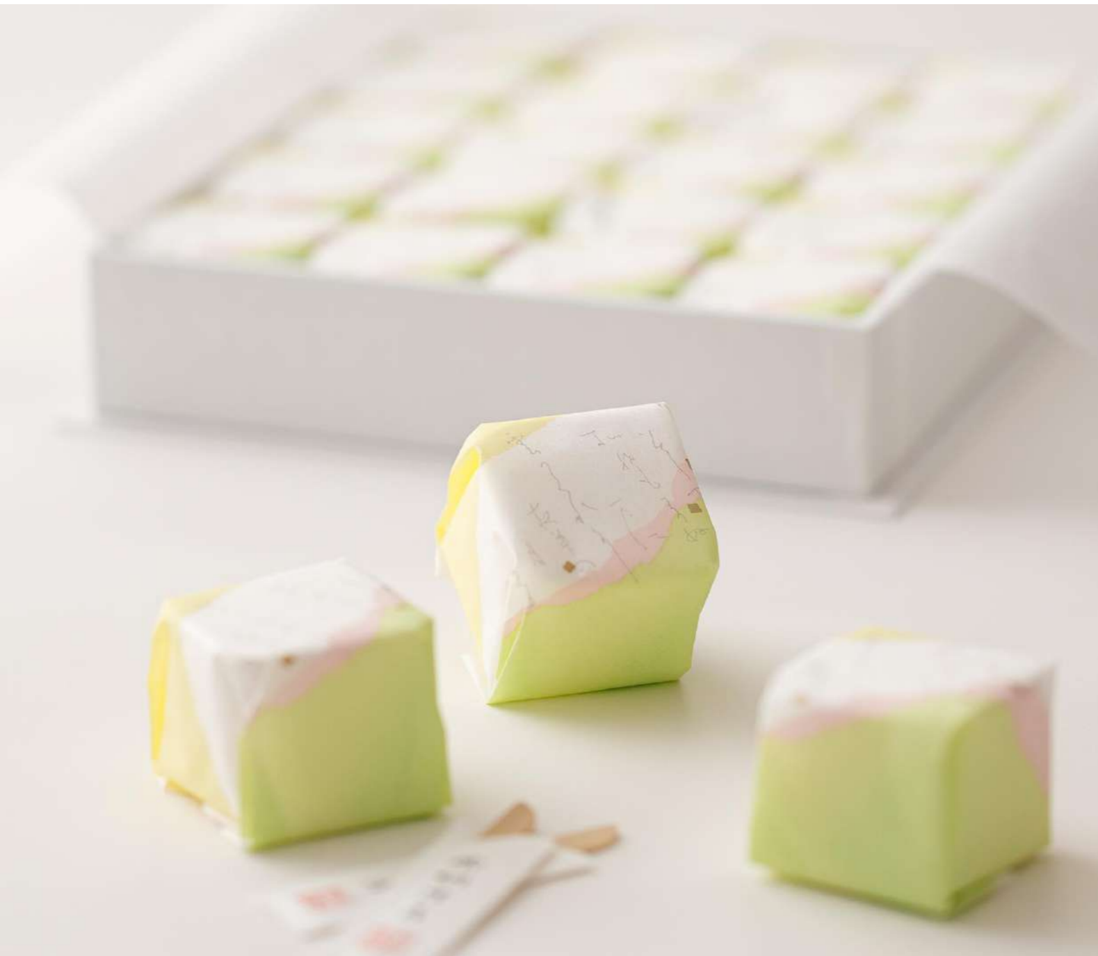
淡く繊細なお菓子の包み紙には、友との再会を月に託して惜しんだ歌「雲がくれ」（紫式部）が書かれています。