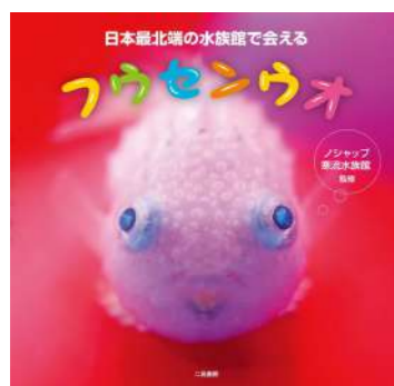
『日本最北端の水族館で会えるフウセンウオ』 監修 / ノシャップ寒流水族館 二見書房 2017年

ダンゴウオ科の魚・フウセンウオ。その名の通り、風船のようにぷくっとふくらんだ愛らしい姿の数々を集めた写真集です。ダンゴウオとともに、癒されること間違いなし。