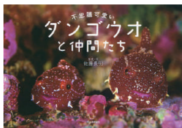
『不思議可愛いダンゴウオと仲間たち 増補新装版』 写真・文 / 佐藤長明 河出書房新社 2022年

ある水族館で出会った魚は、小さくて泳ぎがおぼつかず、その可愛さに胸を打たれました。その魚はまんまるでだんごのような見た目の「ダンゴウオ」です。同じ魚でも赤・白・黄色など、それぞれ色が異なり、おなかの吸盤で草や石にひっつきます。体は2～8cmほどの小ささで風船が飛んでいくように泳ぐ姿は、愛おしさでつい見入ってしまいます。