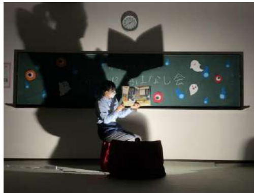
▲真っ暗なお部屋で読み語り中。

また、同じ日の午後には小学生のみを対象にした「こわ〜い!?おはなし会」も開催。真っ暗なお部屋で、こわ〜いおはなしの読み語りを行いました。おはなし会の後は自分だけの「特製お守り」を作成。「これで安心だね！」とお友達同士で見せ合っていました。