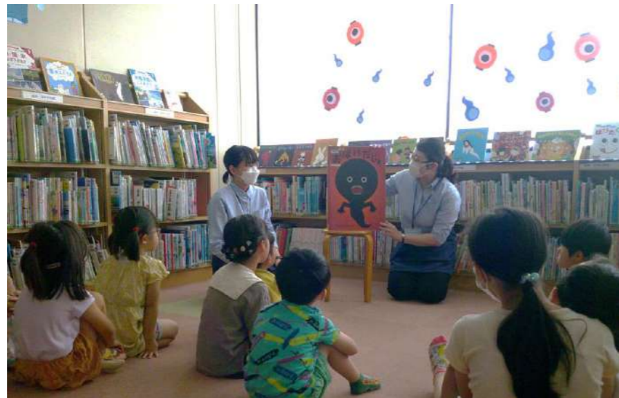
▲読み語りコーナーは特別仕様！たくさんのおばけに囲まれながらのおはなし会です。

6/18(日)の午前中に4歳から小学生までの子どもと保護者を対象に「ちよっこわ〜いかも!?なおはなし会」を開催しました。親子で参加できるこわいおはなし会は、舎人図書館では4年ぶりの催しとなります。子どもも大人もちょっとだけ怖がりながら一緒におはなしを楽しんでいました。おはなし会の後は「紙コップおばけ」の工作も行いました。