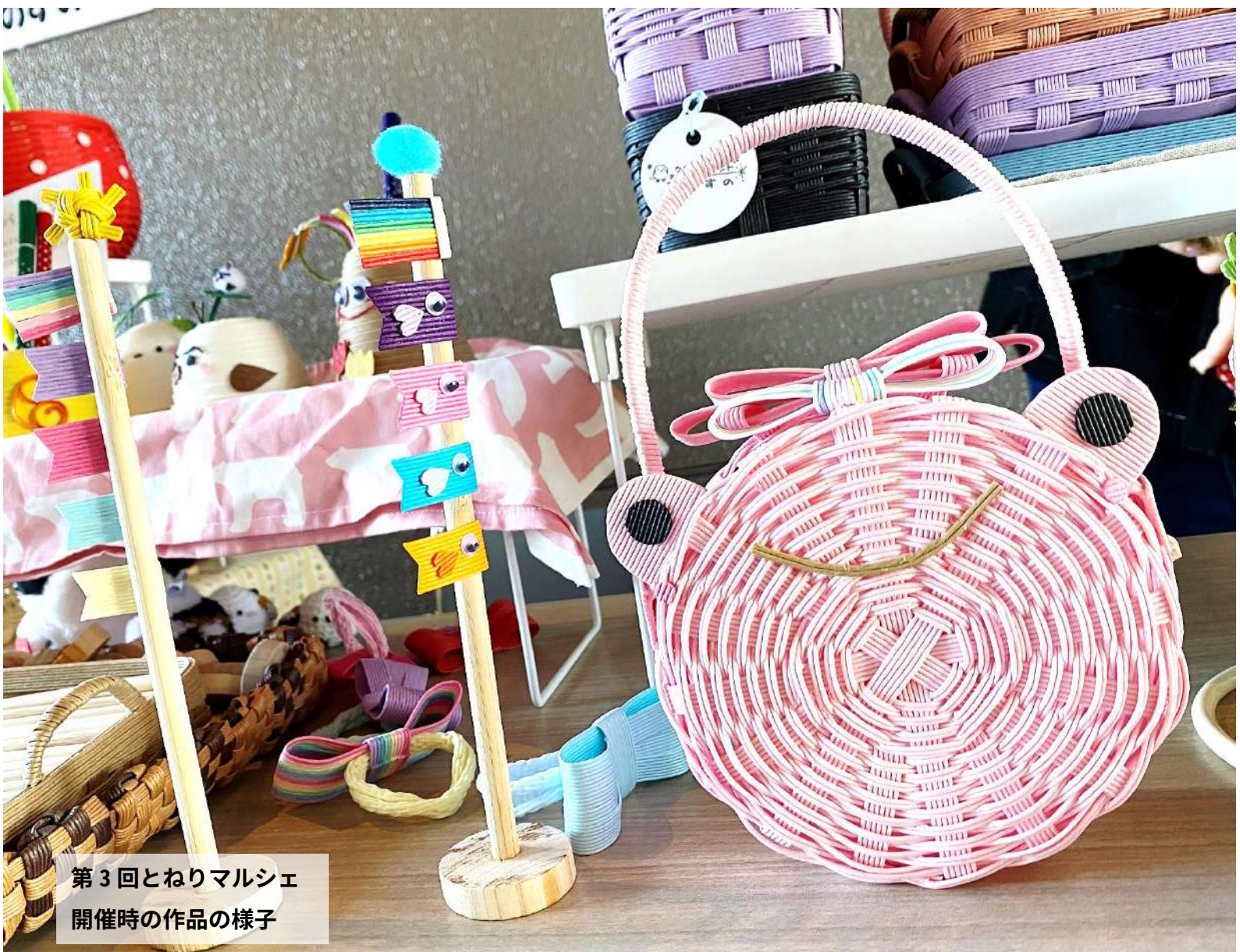
第3回とねりマルシェ 開催時の作品の様子