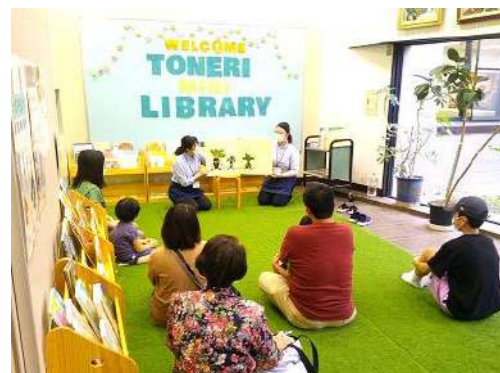
▲野菜をテーマに読み語りを行いました。