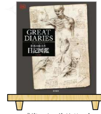
『グレート・ダイアリーズ 世界の偉大な日記図鑑』 編著/DK社 株式会社東京美術 2022年