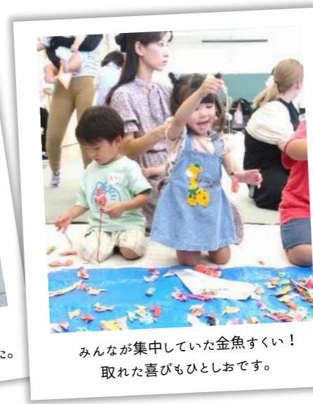
みんなが集中していた金魚すくい！ 取れた喜びもひとしおです。