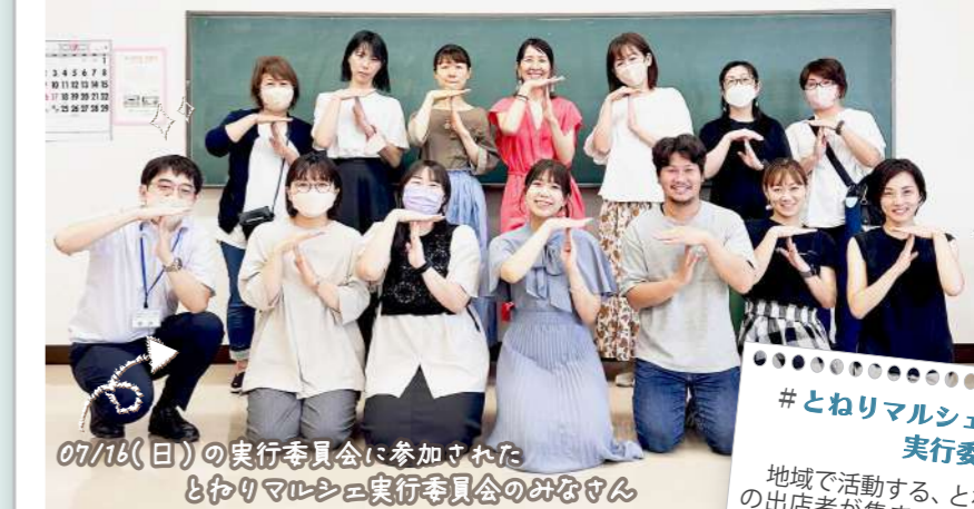
07/18(日)の実行委員会に参加された とねりマルシェ実行委員会のみなさん

#とねりマルシェ 実行委員会とは? 地域で活動する、とねりマルシェの出店者が集まって出来た委員会です。7月と8月に実行委員会を行い、準備を進めました。