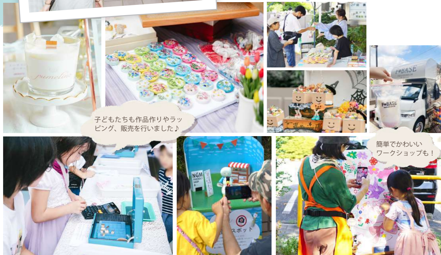
子どもたちも作品作りやラッピング、販売を行いました!