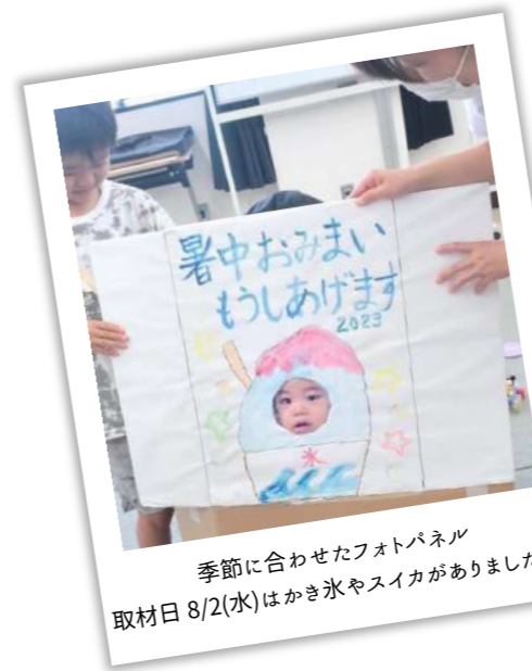
季節に合わせたフォトパネル 取材日 8/2(水)はかき氷やスイカがありました。