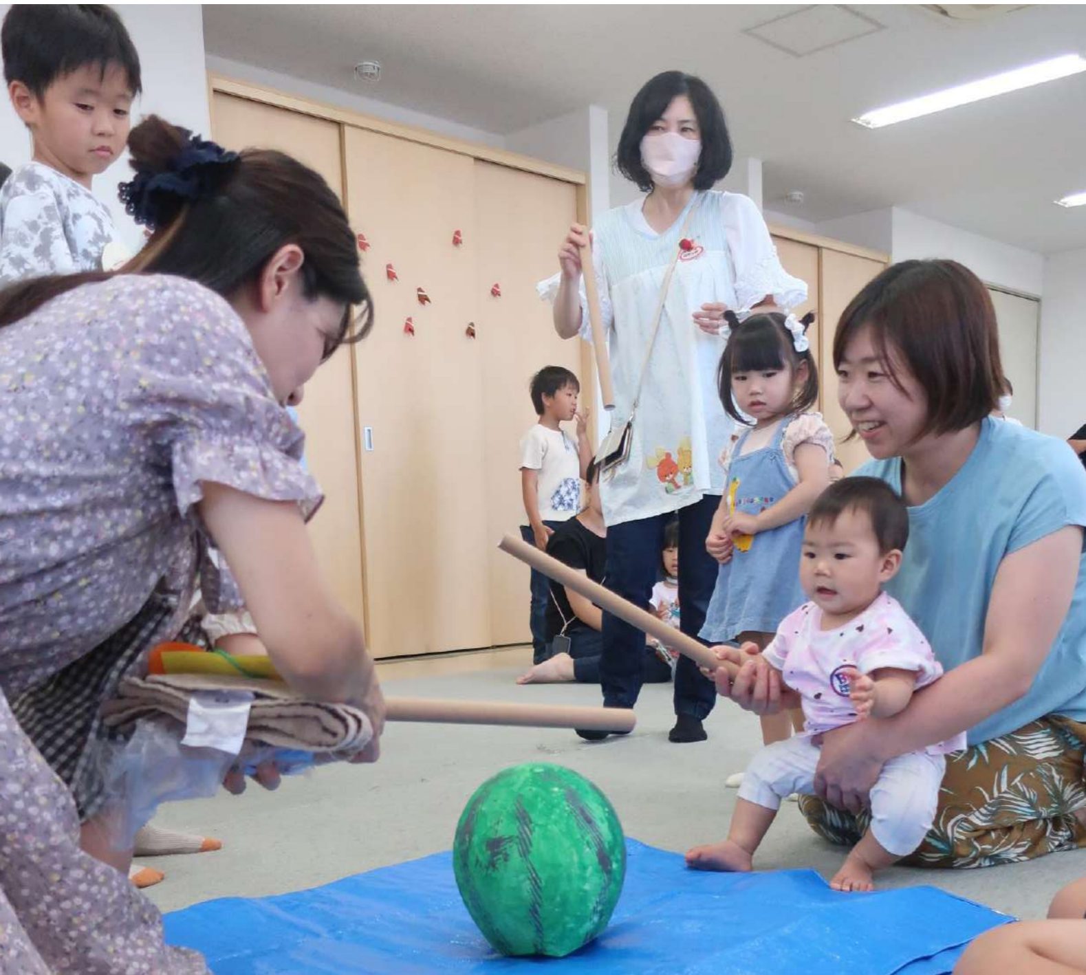
8/2 (水) の活動では、紙のお手製スイカめがけて棒を振り、子どもたちみんなでスイカ割りに挑戦しました！