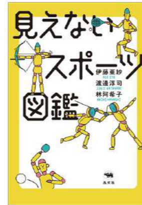
『見えないスポーツ図鑑』