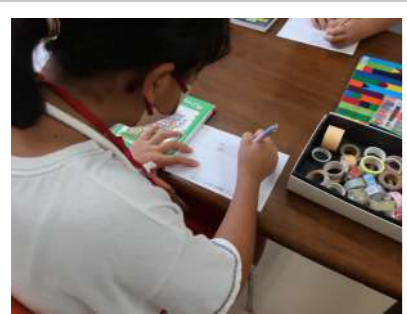
▲本の魅力が伝わるよう挑んだPOP作り。みんな素敵な仕上がりになりました。

体験中に作ってもらったPOPは「夏休み1日図書館員の棚」として8/30(水)まで展示しました。参加した子ども達からは「大変だけど楽しかった」「また体験したい!」といった感想をいただきました。また来年も、小学生の図書館員さんをお待ちしております。