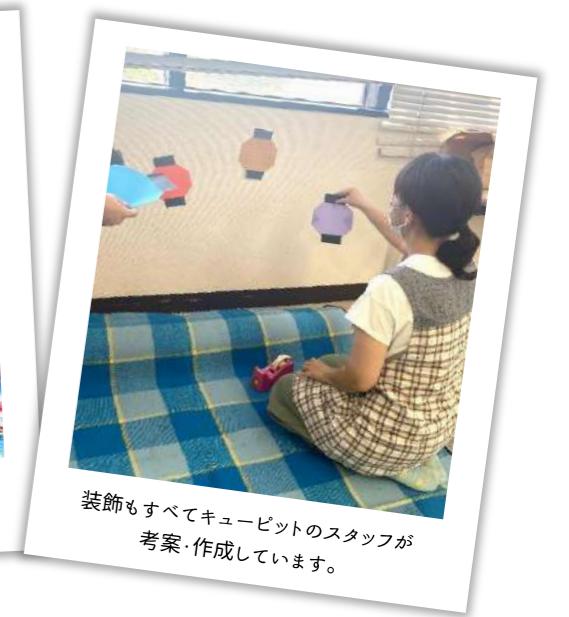
装飾もすべてキューピットのスタッフが 考案・作成しています。