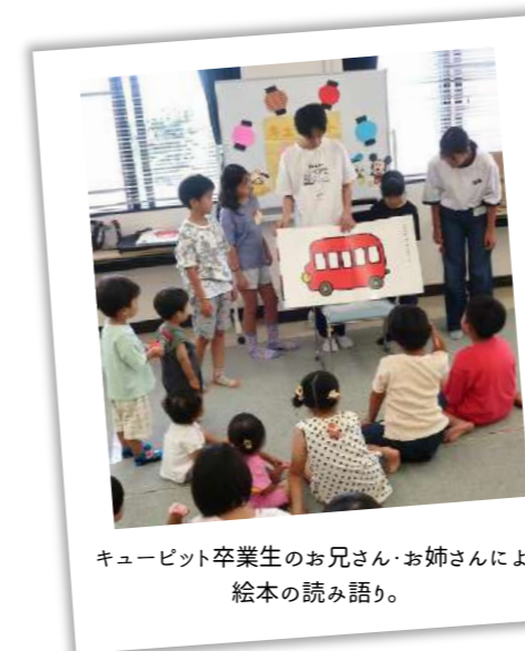
キューピット卒業生のお兄さん・お姉さんによる 絵本の読み語り。

次号は、コロナ禍を経て現在までのキューピットの活動・変化についてお話を伺います。