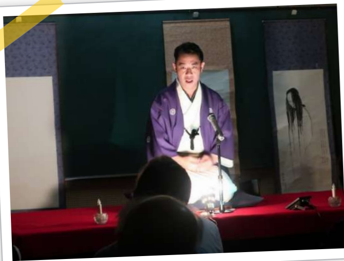
▲ご自身の経験談から聞き語りまで、"城谷節"が光ります。

今回の演目は、「百物語」「丑の刻参り」「死者からの電話」の3席。怖いだけでなく、くすっと笑えて時々泣ける"城谷節"が全開に繰り広げられ、あっという間の2時間でした！