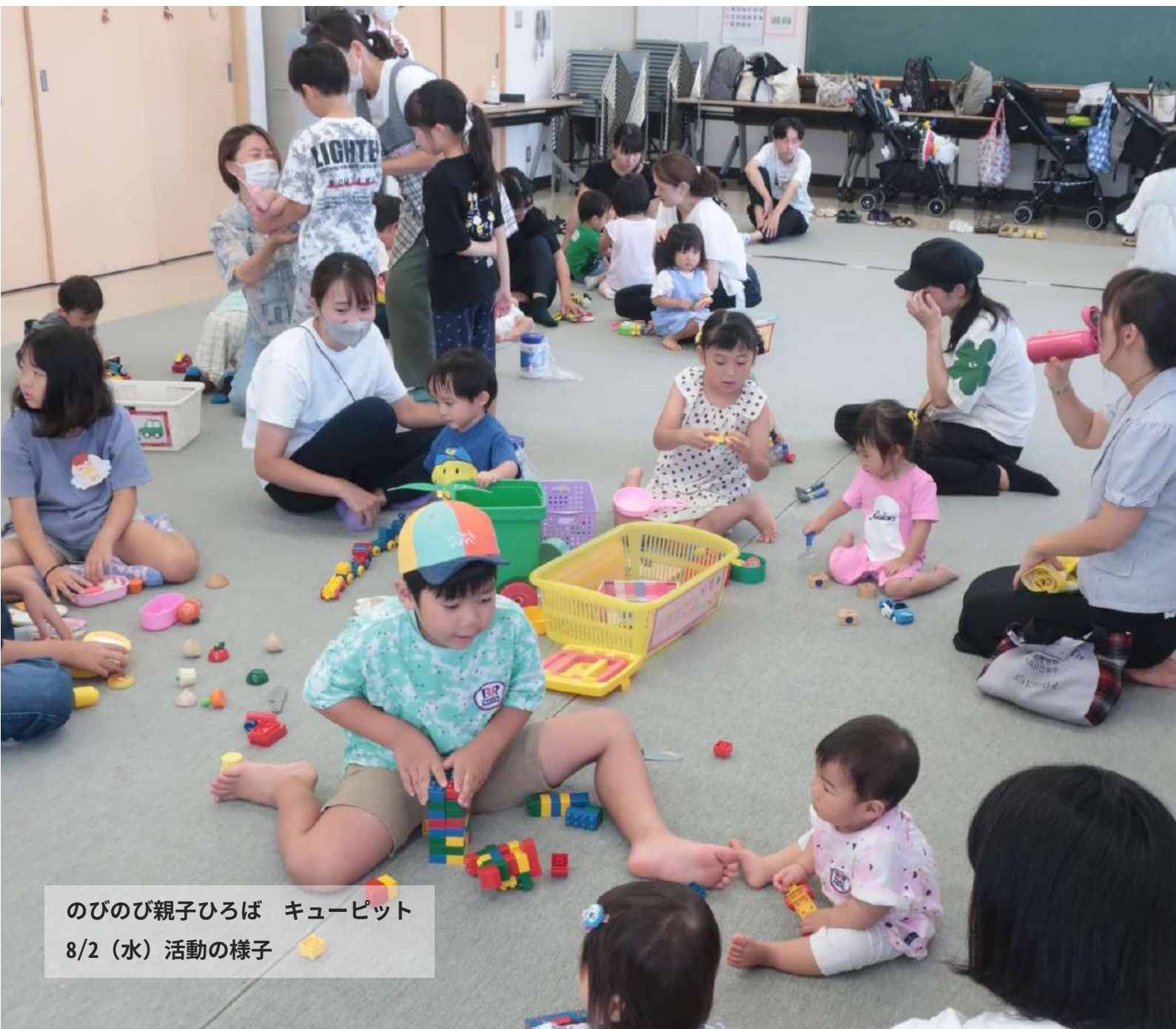
のびのび親子ひろば キューピット 8/2(水) 活動の様子