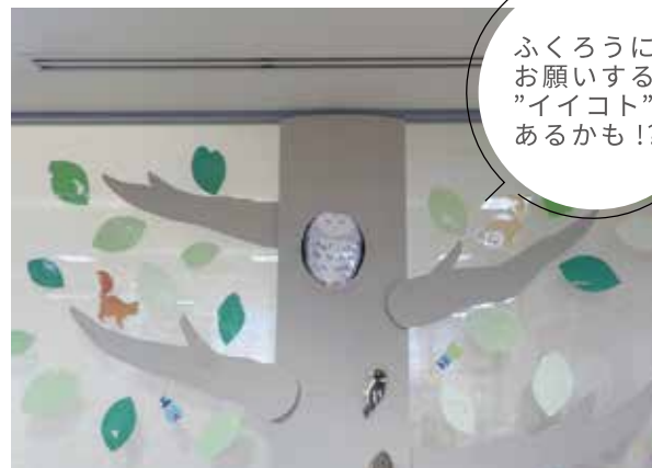
ふくろうにお願いすると”イイコト”があるかも!?

本を3冊借りるごとに紙で出来たお弁当のおかずがもらえるよ！いっぱい本を読んで自分だけのお弁当を作ろう！