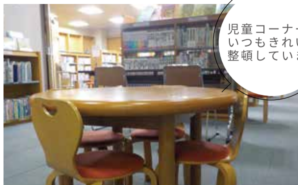
児童コーナーはいつもきれいに整頓しています