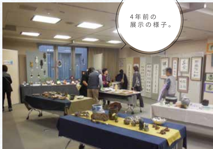
4年前の展示の様子。

久しぶりの開催になりますが、みなさまに楽しんでいただけるよう準備を進めています。みなさまのご来場心よりお待ちしております。