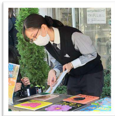
▲稲から白米になる様子を説明