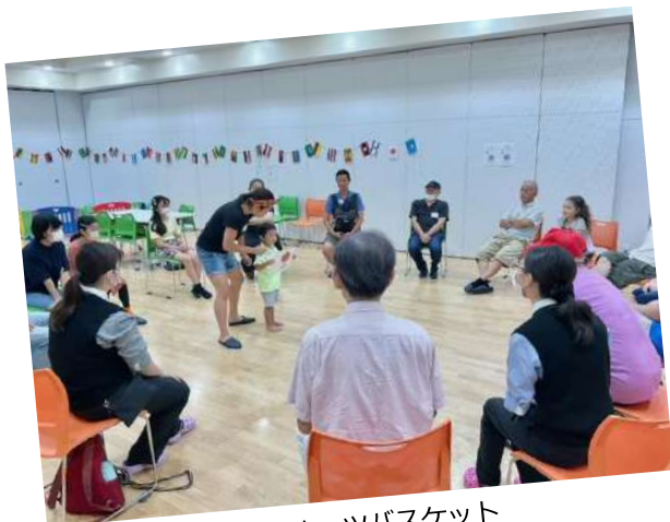
▲最初はみんなでフルーツバスケット

10/1 (日) に開催した第5回では、ボードゲームをしながら自由に交流しました。まずは、参加者みんなで「フルーツバスケット」を行い、最初は緊張している様子でしたが、徐々に打ち解けていき、大盛り上がりとなりました。