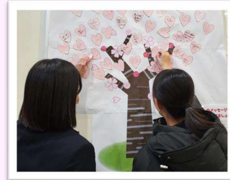
▲昨年の参加者がメッセージを貼る様子

昨年、「高校受験生応援団」に参加した先輩たちに、面接の練習はどう役に立ったか、本番ではどんな質問をされたのかお聞きしました。