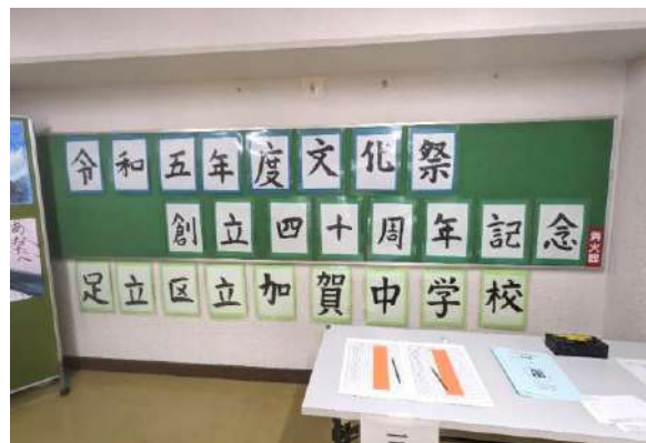
▲創立40周年の年に本格的な文化祭が復活

今年度の文化祭テーマは「 いち 」。これには一生懸命、一致団結、今までで一番などたくさんの意味がこめられています。