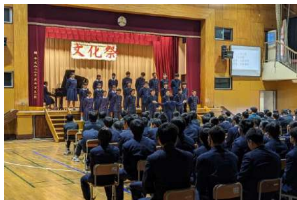
▲3学年課題曲『心の瞳』を合唱している様子

後ろで見学していた保護者も感激している様子で、合唱後は盛大な拍手が沸き起こりました。