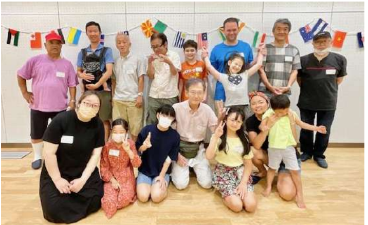
▲アメリカ・ウクライナ・ベトナムの方も参加してくださりました