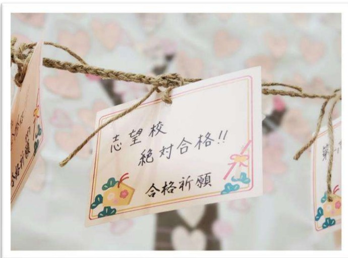
▲昨年鹿浜大師に飾られた絵馬

絵馬は、模擬面接の「高校受験生応援団」に参加した方だけでなく、今年度受験生の方には、1階窓口でお渡ししております。受験への意気込み、挑戦したいこと、頑張りたいことなど、自分の願いを絵馬に書いて、絵馬掛所に願いを込めながら結びましょう。