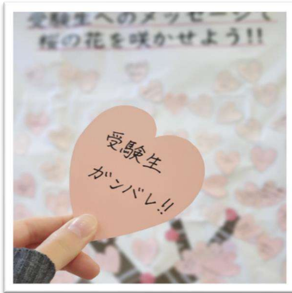
▲昨年の応援メッセージと桜の木

こちらの花びらのメッセージカードは、鹿浜センター1階窓口にてお配りしています。どなた様でも参加可能です。受験生の方はお互いの応援や受験への意気込みを、受験を経験した方は受験の思い出やアドバイスなど、様々なメッセージをお待ちしております。