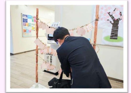
▲昨年の参加者が絵馬を飾る様子

受け答えだけでなく、イスに座るまでの所作や、扉の開け方なども指摘してもらえて、やってよかったと思いました。