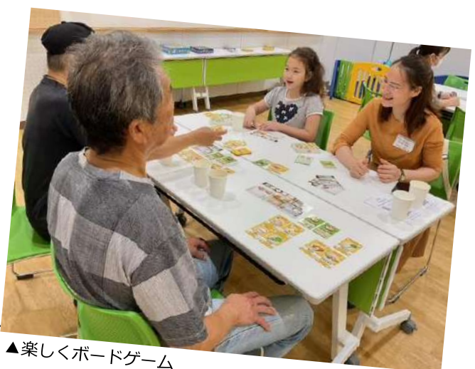
▲楽しくボードゲーム

今回、13種類のボードゲームをご用意。イギリス発祥のパズルゲームでは参加者全員歓声を上げながら楽しんでいて、フランス発祥の陣取りゲームでは、戦略に頭を悩ませている様子でした。年齢や国籍関係なく、ルールを教え合ったり、おしゃべりしたりしながら、交流を楽しみました。