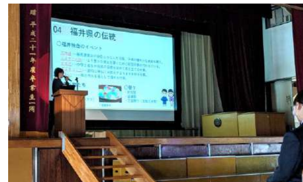
▲「総合的な学習の時間」の発表の様子

「総合的な学習の時間」の発表では、学年ごとにテーマを決め、その学習の成果を発表しました。1学年は「魚沼自然教室」、2学年は「上級学校訪問」で訪れた高校の紹介、3学年は修学旅行で行った「北陸」について、学年の代表者が発表を行いました。