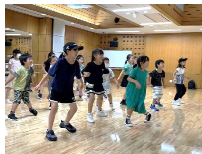
午後 1 時 20 分～2 時 ヒップホップダンス(ピンクフェアリー)