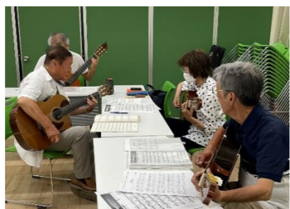
午後 2 時 10 分～2 時 40 分 ギター(保塚ギタークラブ)