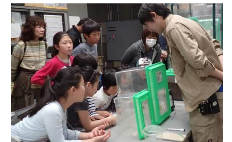
うらがわ探検ツアーの様子