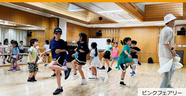
ピンクフェアリー