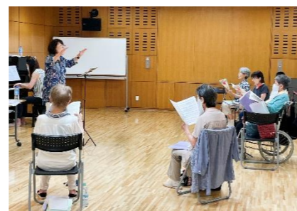
午後 2 時 50 分～3 時 20 分 コーラス(あんさんぶる シャンテ・クール)