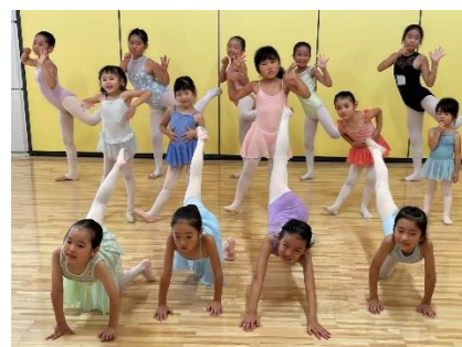
午前 11 時～11 時 30 分 バレエ(モダンバレエ アリスの会)