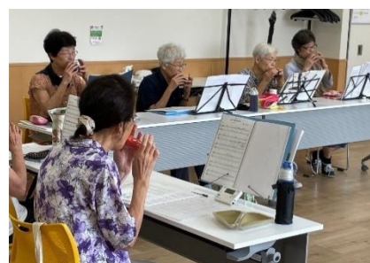
午後 1 時 30 分～2 時 オカリナ(オカリナの会)