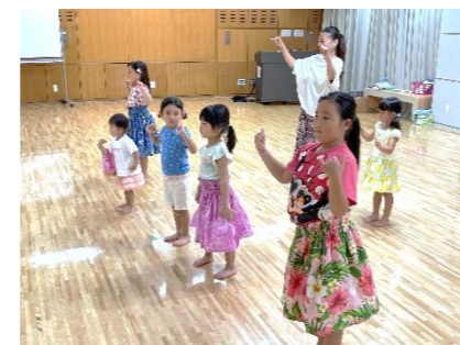
午後 2 時 10 分～2 時 40 分 フラダンス(フラサークル レファ)