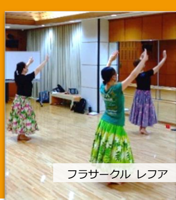
フラサークル レファ