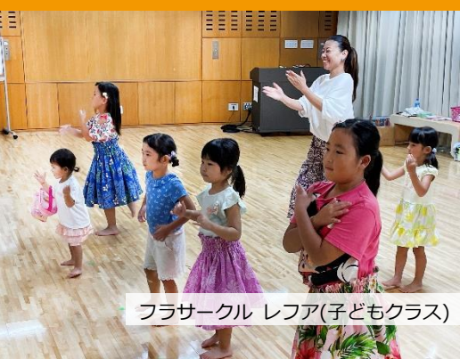
フラサークル レファ(子どもクラス)