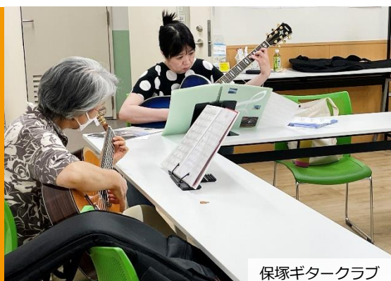
保塚ギタークラブ