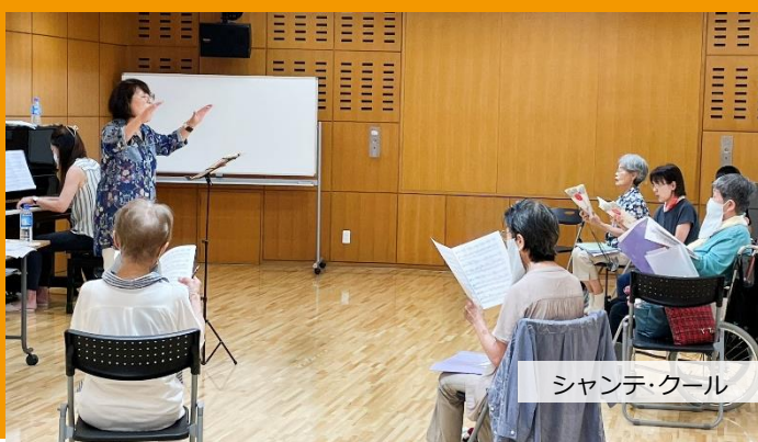
シャンテ・クール